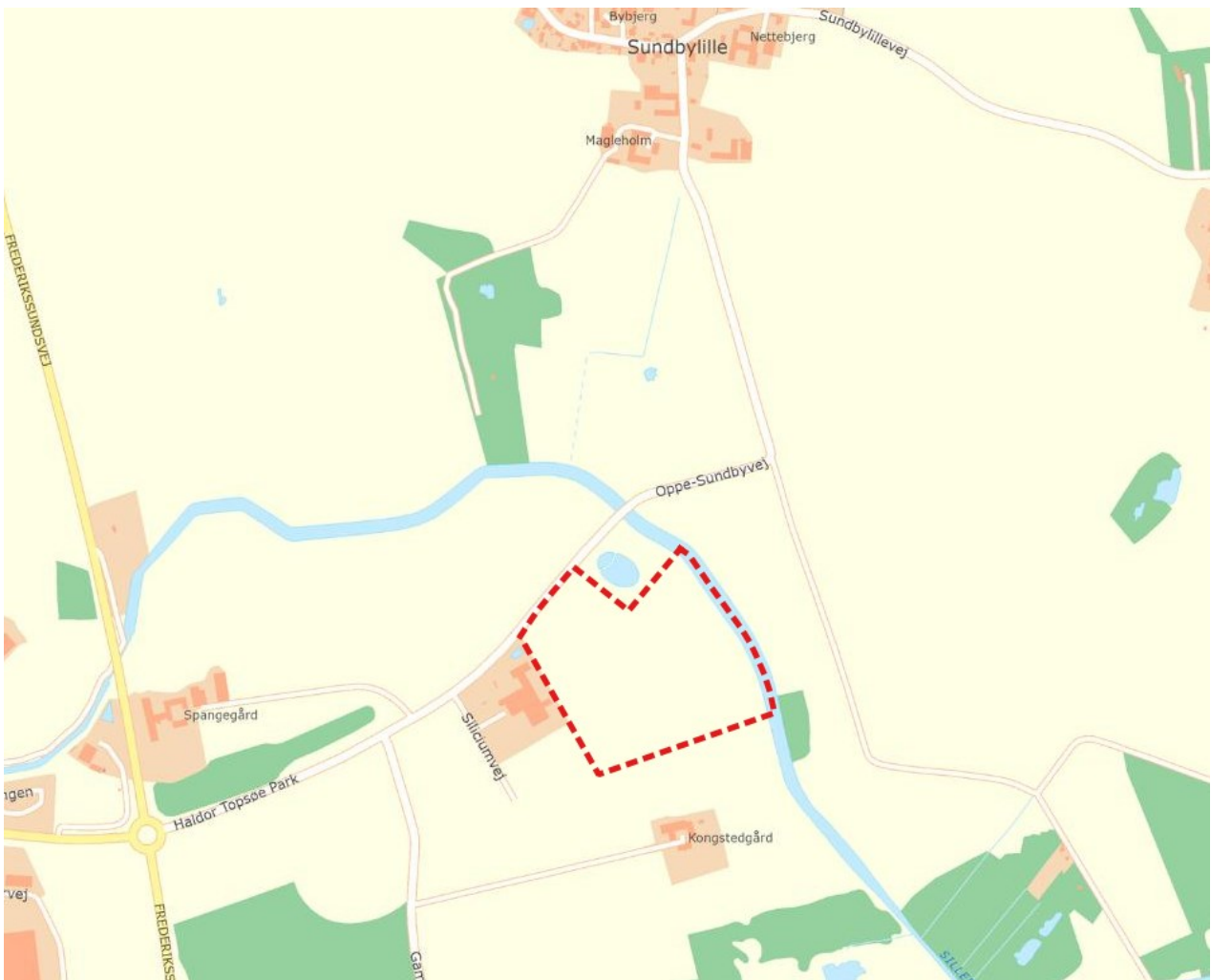
Lokalplanområdet med nære omgivelser